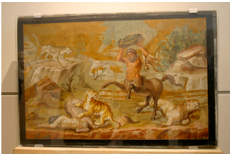
Kentaurmosaikk fra Alte Museum Berlin