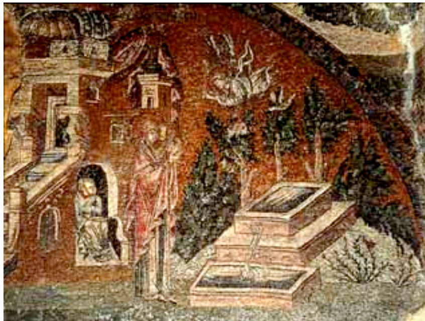
Annas bebudelse fra Chorakirken